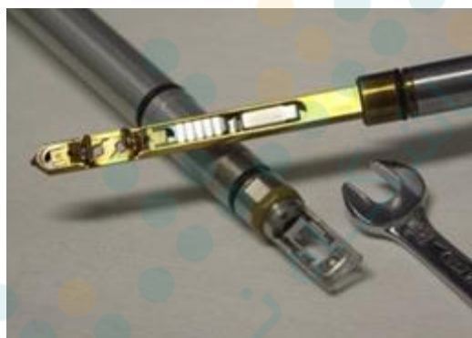
شکل ۲- نگهدارنده نمونه در میکروسکوپ الکترونی عبوری [۱۱].

محفظه نمونه یکی از قسمت‌های بسیار مهم میکروسکوپ می‌باشد که در زیر قسمت سیستم متمرکز کننده قرار دارد. باید نمونه‌ای بسیار کوچک به طور بسیار دقیقی در جای مناسب خود در بین عدسی‌های شیئی قرار گیرد. محفظه نمونه باید بتواند در حد چند میلی‌متر جابجا شده و به میزان زیادی بچرخد. علاوه بر این اگر از میکروسکوپ برای آنالیز شیمیایی نیز استفاده شود، پرتو X باید بتواند از این محل خارج شود. برای دستیابی به این مشخصات از میله نگهدارنده نمونه استفاده می‌شود که می‌تواند نمونه‌ای به قطر ۳ میلی‌متر یا کوچکتر را که بر روس شبکه حمایتی با اندازه ۳ میلی‌متر قرار دارد، مابین قطب‌های عدسی‌های شیئی قرار دهد. شکل ۲، نگهدارنده نمونه در میکروسکوپ الکترونی عبوری را نشان می‌دهد.